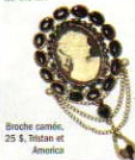
Broche camée, 25 $, Tiltan et America

Le style vintage est toujours tendance cette saison; vous ne pourrez pas passer à côté! Voici mes coups de cœur: