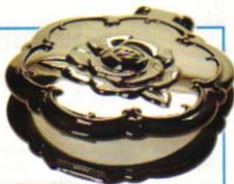
Miroir précieux, 28 $, Anna Sui