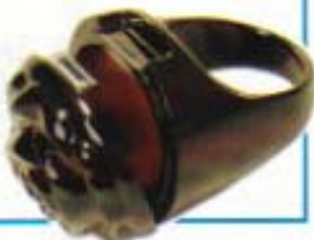
Bague à rouge à lèvres, 24 $, Anna Sui